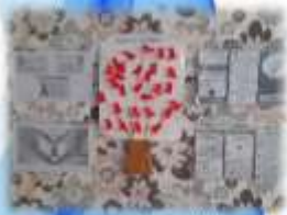
Информационная акция «Дерево здоровья»