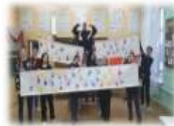
Профилактическая акция «Ладони» / волонтерский отряд Amteam