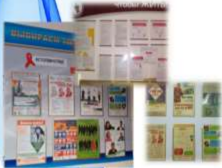
Оформление информационных стендов