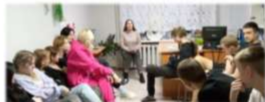
Круглый стол «ВИЧ касается каждого»

06 марта 2024 г. специалистами ГАУЗ СО «ОЦ СПИД» на площадке техникума в рамках реализации программы профилактики ВИЧ-инфекции в ГАПОУ СО "АМТ" было проведено обучение волонтеров Штаба здоровья и волонтеров «АМТeam». Волонтеры получили ответ на вопрос- что могут