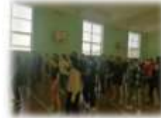
Флешмоб «Танцуй ради жизни»/ волонтерский отряд Amteam