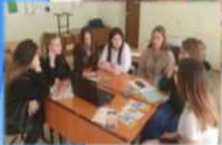
Круглый стол «Черная болезнь-СПИД»