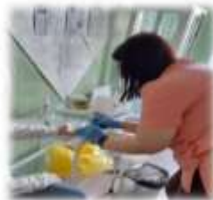
Проведение экспрес- тестирования