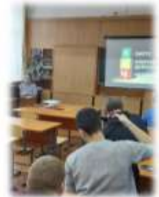
Откровенный разговор "ВИЧ: касается каждого!" / МБУК "ЦБС" п.м. А.С. Пушкина