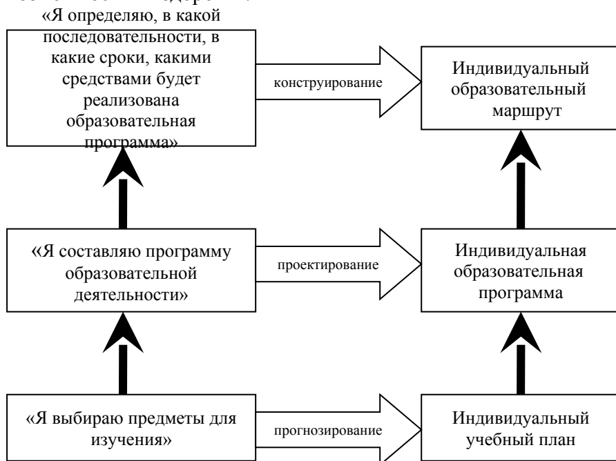
Рис. 1. Соотношение индивидуального учебного плана, индивидуальной образовательной программы и индивидуального образовательного маршрута в Концепции профильного обучения на старшей ступени общего образования

Данная схема позволяет в полной мере раскрыть содержание и соотношение обозначенных нами понятий и является важной для понимания сущности проектирования индивидуальных образовательных программ для обучающихся с ограниченными возможностями здоровья.